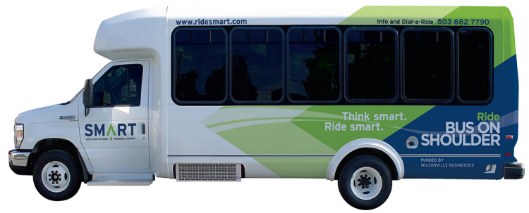
El servicio SMART 2X viajará en el corredor piloto del Autobús en el arcén.

¿Habla usted español? Podemos proveer la información en esta publicación en español. Para recibir la información en español, por favor llame al (503) 731-4128.